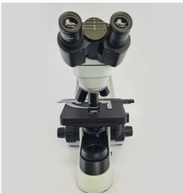
Microscopio optico pdf unam.